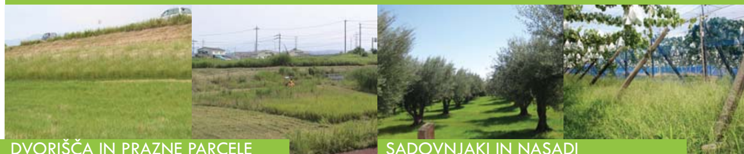
DVORIŠČA IN PRAZNE PARCELE